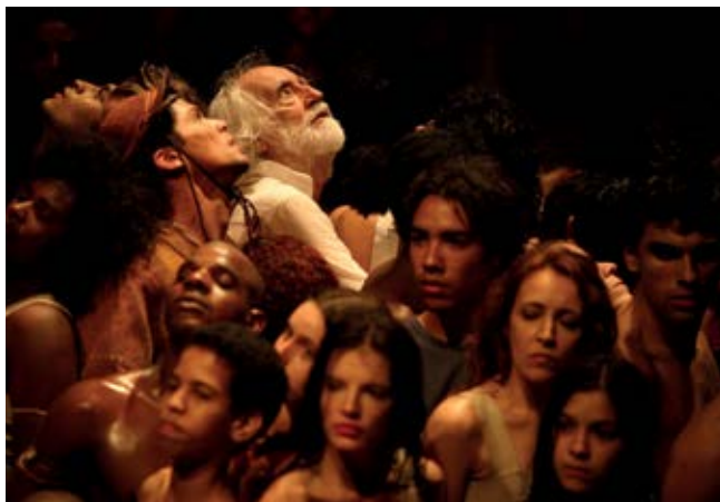
■ Os Sertões (2002)