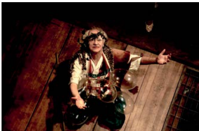
■ As Bacantes (2016)

As Bacantes , e ela fala ainda hoje. Tem alguma coisa que existe no ar, uma repressão. O problema de tudo não é a sociedade. É o dinheiro, o capitalismo rentista que criou o momento de maior desigualdade na história. Depois de 1964, houve um retrocesso enorme no Brasil. Hoje, por exemplo, para fazer humor é só pegar frases baseadas nas coisas que estão acontecendo por aqui, na piração, na burrice, que é engraçadíssimo. Com essa história de ter que fazer greve aos domingos, eu me sinto em 1984. Com meus 80 anos, eu estou presenciando coisas que jamais imaginava ver na minha vida. É um momento velho e novo ao mesmo tempo.